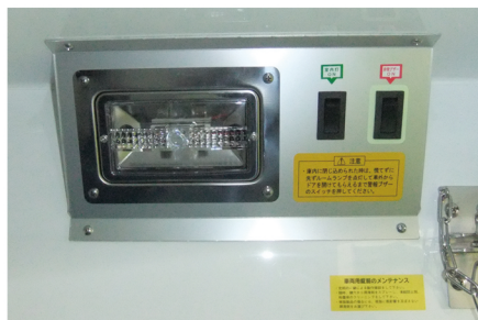
庫内灯・庫内スイッチ