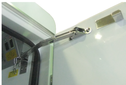
右バックドア90度ストッパー