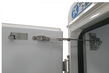
左バックドア90度ストッパー